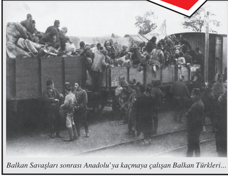
Balkan Savaşları sonrası Anadolu'ya kaçmaya çalışan Balkan Türkleri...

Türk milletinin sosyolojik olarak normalleşmesi için büyük felâketlerinin yasını tutması lâzımdı, tutmadık. Hiçbir kaybımızın yasını tutmadığımız için büyüklüğümüz, bütünlüğümüz tartışılır olmuştur. Umarım ki Ali Özsoy Balkanlar'da Türk Soykırımı kitabıyla Türk'ün bu yas tutma sürecini başlatmaya sebep olur.